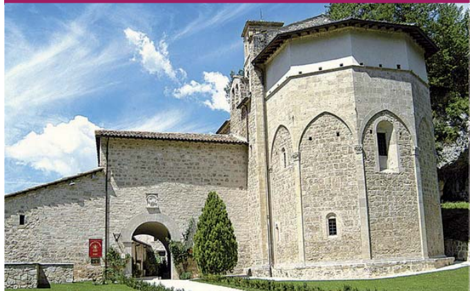
Chiesa di Santa Croce