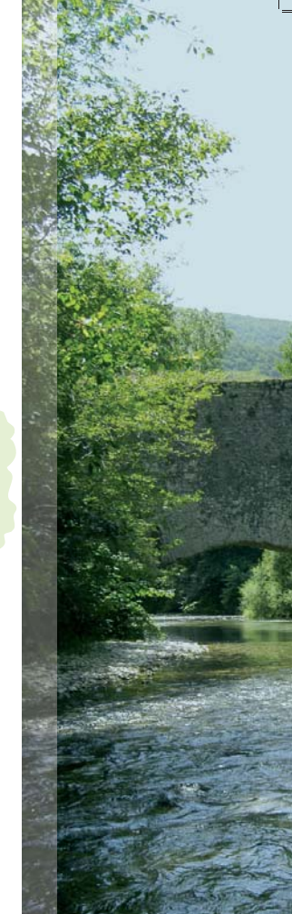
Stretto di Biselli

Itinerario Cascia – Roccaporena: l'itinerario prende avvio alla chiesa di Sant'Antonio Abate, sede del primo polo del circuito museale urbano, per poi proseguire nella visita dei principali monumenti del centro e del Museo civico di Palazzo Santi. L'itinerario, dopo l'accesso al santuario dedicato a Santa Rita, si conclude a Roccaporena, con i luoghi significativi della vita della Santa. Durata – compresi gli spostamenti h 4.