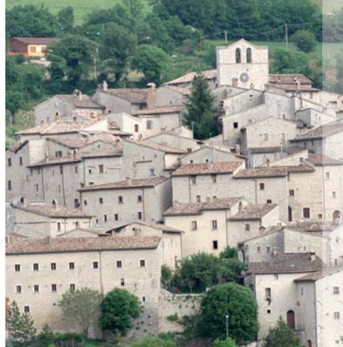
Vallo di Nera – Panorama

Itinerario della bassa Valnerina: la visita guidata partendo da Scheggino, prevede l'ingresso all'ecomuseo della Valnerina-antenna del tartufo; prosegue poi con l'abbazia di S. Pietro in Valle e termina con le strutture fortificate del borgo di Ferentillo. Durata – compresi gli spostamenti – h 4.