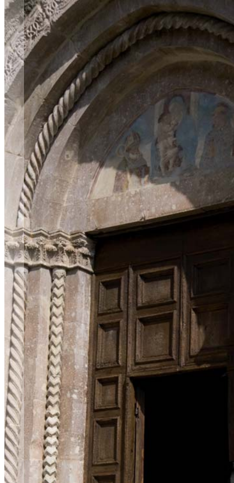
Portale di S. Agostino - Cascia