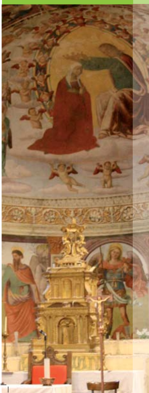
Gavelli Chiesa di S. Michele

Itinerario della media Valnerina: partendo da Cerreto di Spoleto, si prosegue con la visita dell'ecomuseo della Valnerina-antenna del Ciarlatano; toccando il borgo medievale di Vallo di Nera, l'itinerario si conclude all'abbazia dei Santi Felice e Mauro presso Castel San Felice. Durata – compresi gli spostamenti – h 4.